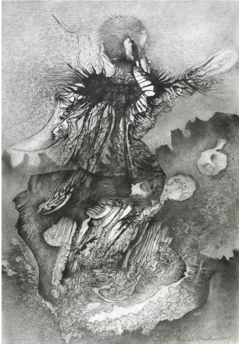
A2-2-2023 , 2023, crayon graphite, poudre de graphite, pâte de graphite, 59,4 x 42 cm