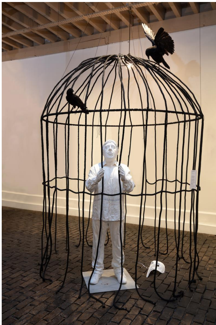
Self Portrait – Mes corbeaux , 2020, installation : résine, textile, acrylique, corde synthétique, corbeaux empaillés, 280 x 180 x 180 cm