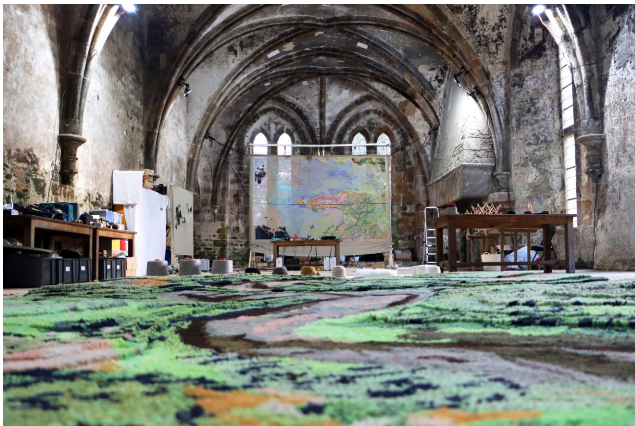
Atelier participatif Pays'Âges , 2023, Abbaye de Beauport, Paimpol, et présentation de la tapisserie-témoignage du Fleuve Laïta, au premier plan