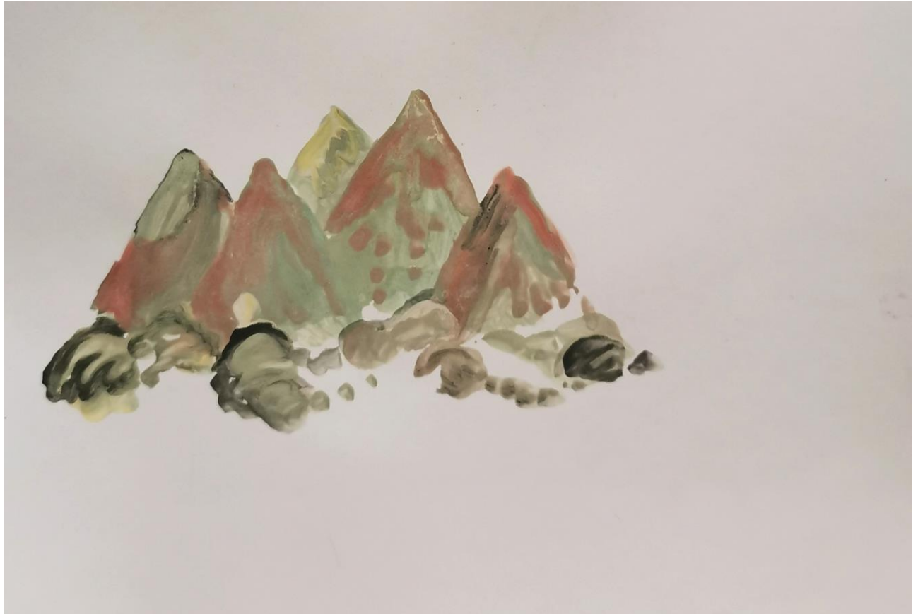
Magic mountains , 2023 techniques mixtes sur papier, 21 x 29,7 cm