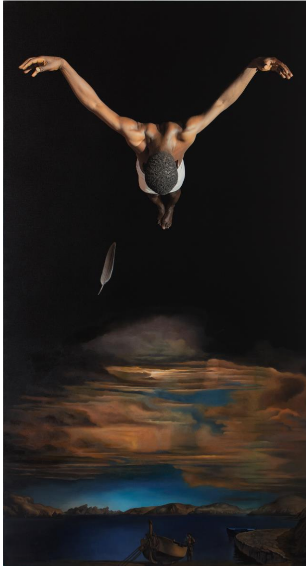
Icare – La plume , 2023 photographie et huile sur toile, 200 x 108 cm