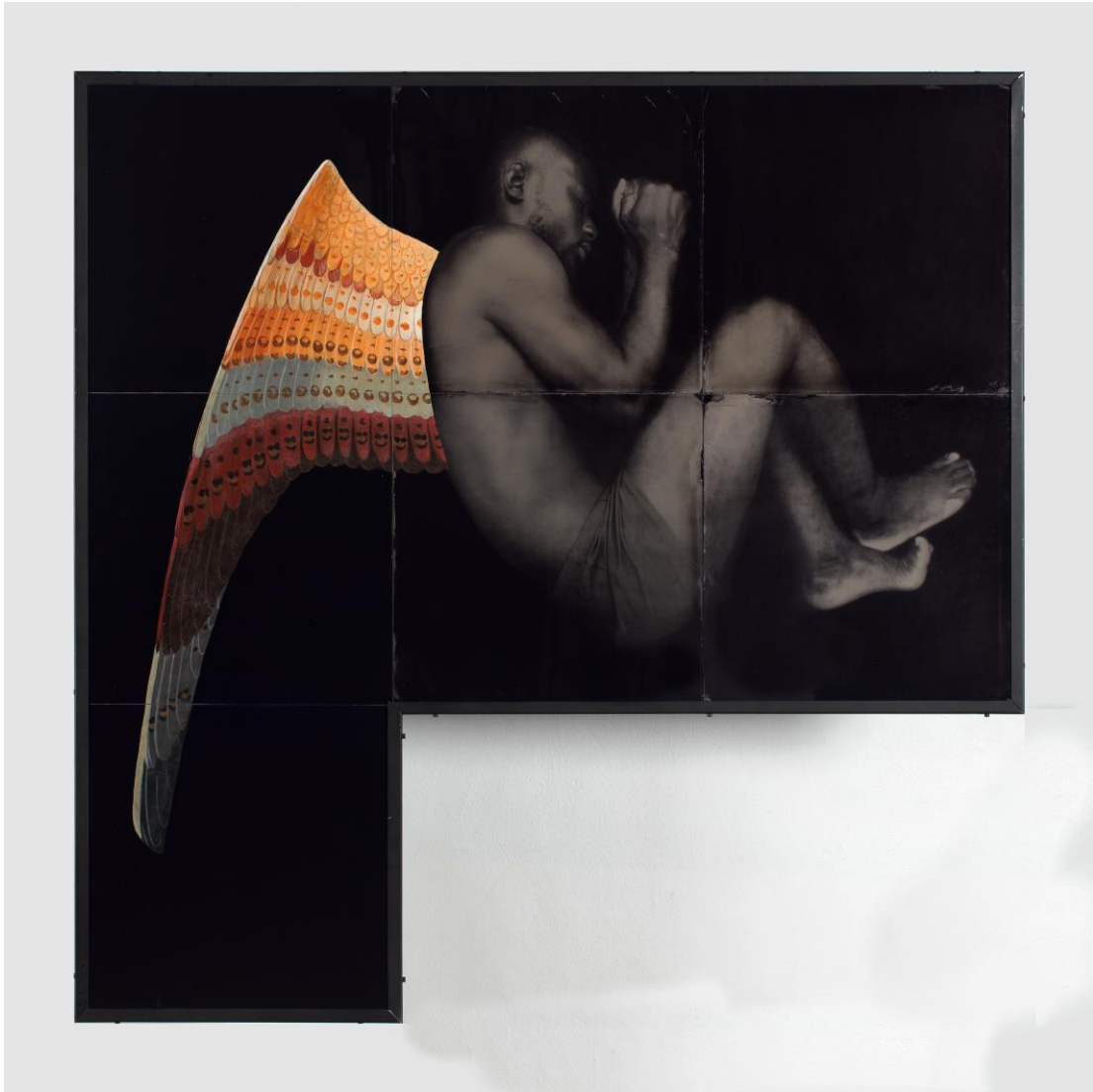
Icare – L'Annonciation, 2022 ambrotypes, verre, peinture sur verre, métal 120 x 120 cm