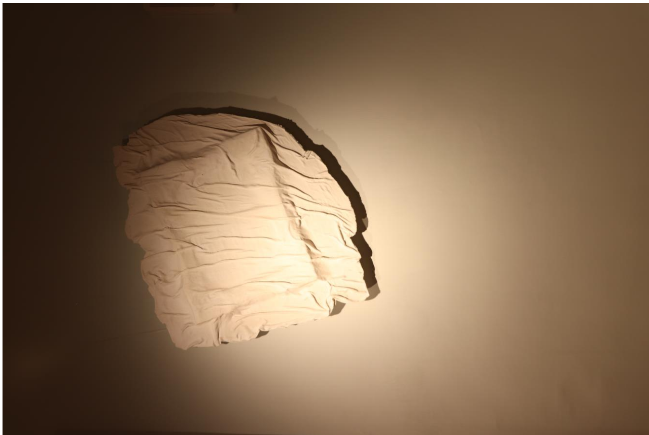
Emporté par la houle, 2023, tissu et plâtre, 60 x 50 x 10 cm