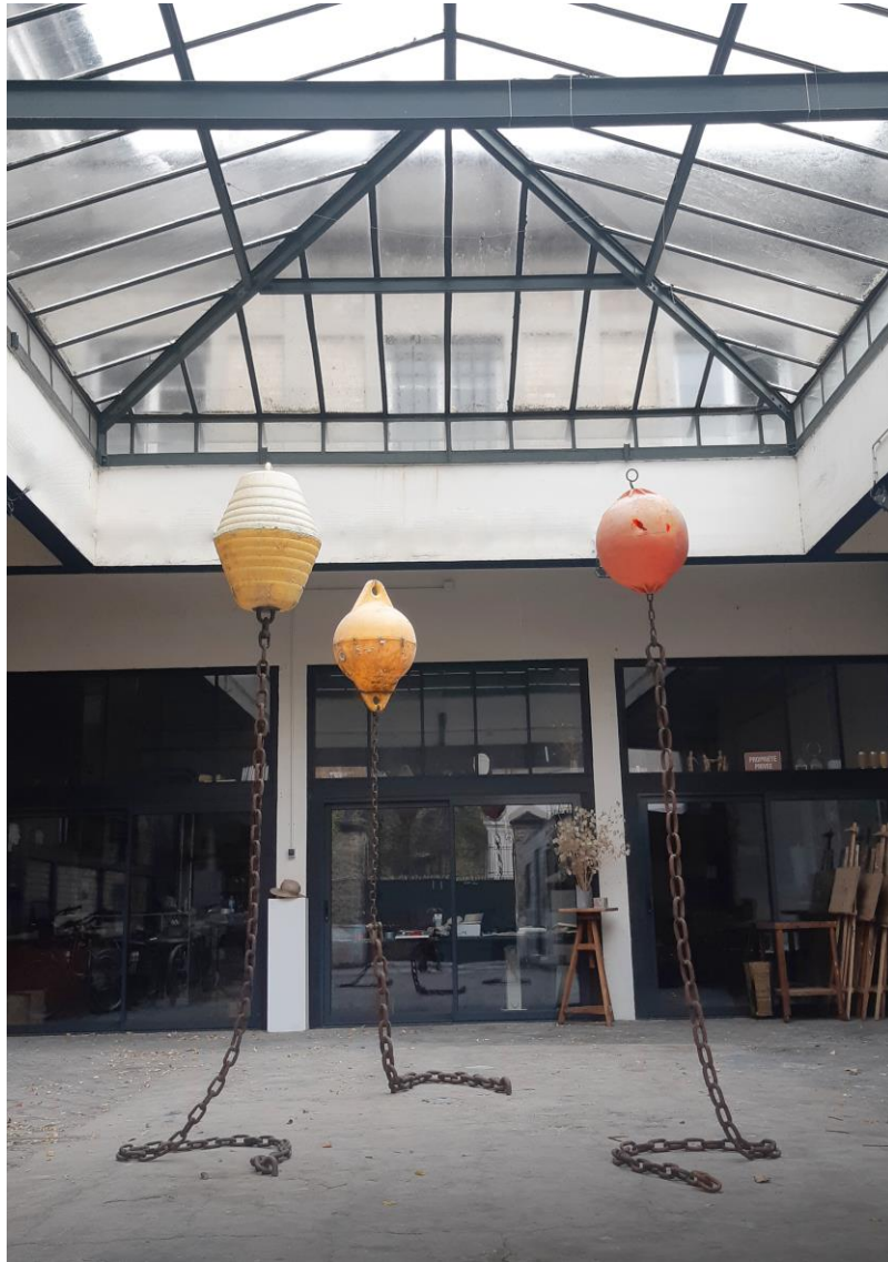
Face à la mer, n° 6 & 7 (2019) et 16 (2023), bouées marines et chaînes métalliques de rebut, environ 275 x 70 x 60 cm