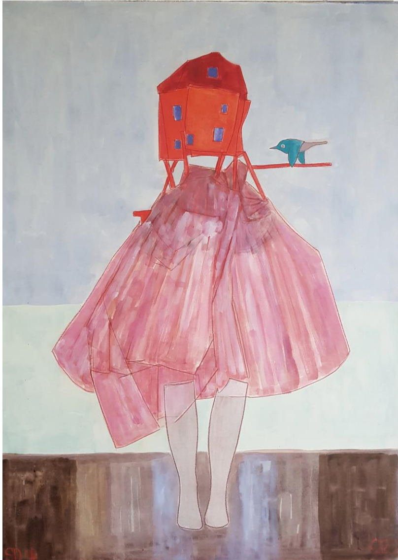
Little Red Riding House , 2020 gouache et cire sur papier marouflé sur toile, 100 x 73 cm