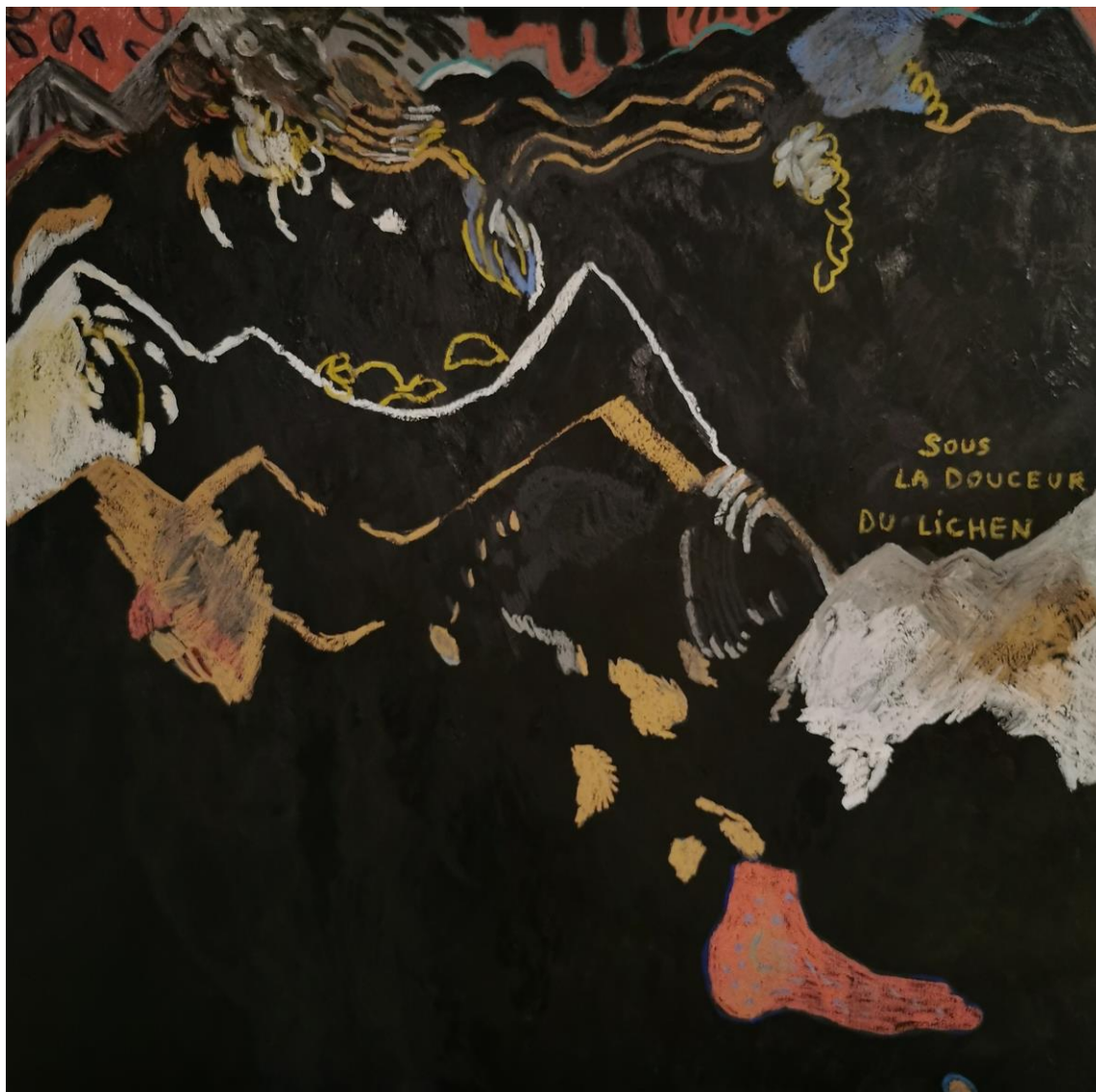
Sous la douceur du lichen, la dureté de la roche, 2023 techniques mixtes sur toile, 120 x 120 cm