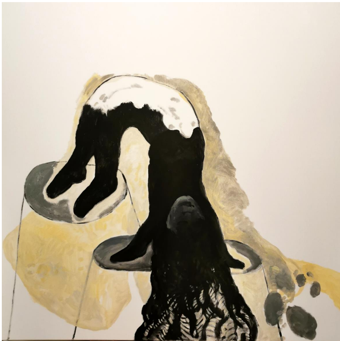
Terremoto, autoportrait au séisme, 2023 peinture acrylique sur toile, 120 x 120 cm