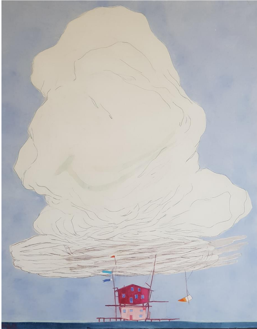
Maison perchée rose et nuages, 2022, gouache et cire sur papier marouflé sur toile, 100 x 81 cm