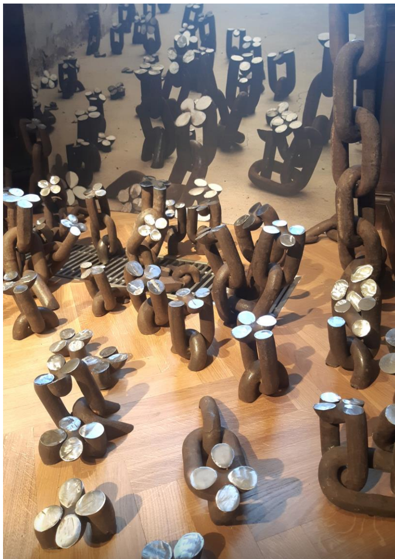
Fleurs de Terezín , 2022, maillons de chaînes métalliques de rebut, coupés, soudés et polis et, en arrière-plan, photo de l'installation dans le camp de Terezín, Tchéquie, dimensions variables