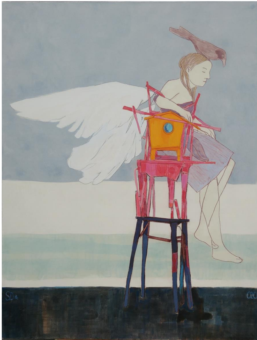
Perchée, les pieds dans l'eau, 2020 gouache et cire sur papier marouflé sur toile, 110 x 84 cm